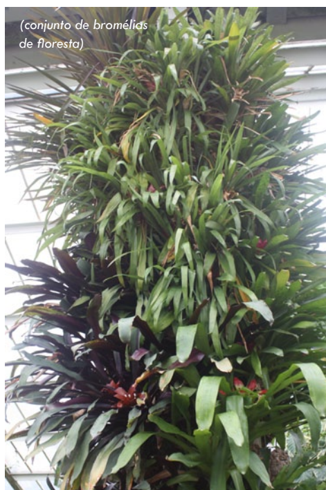
(conjunto de bromélias de floresta)